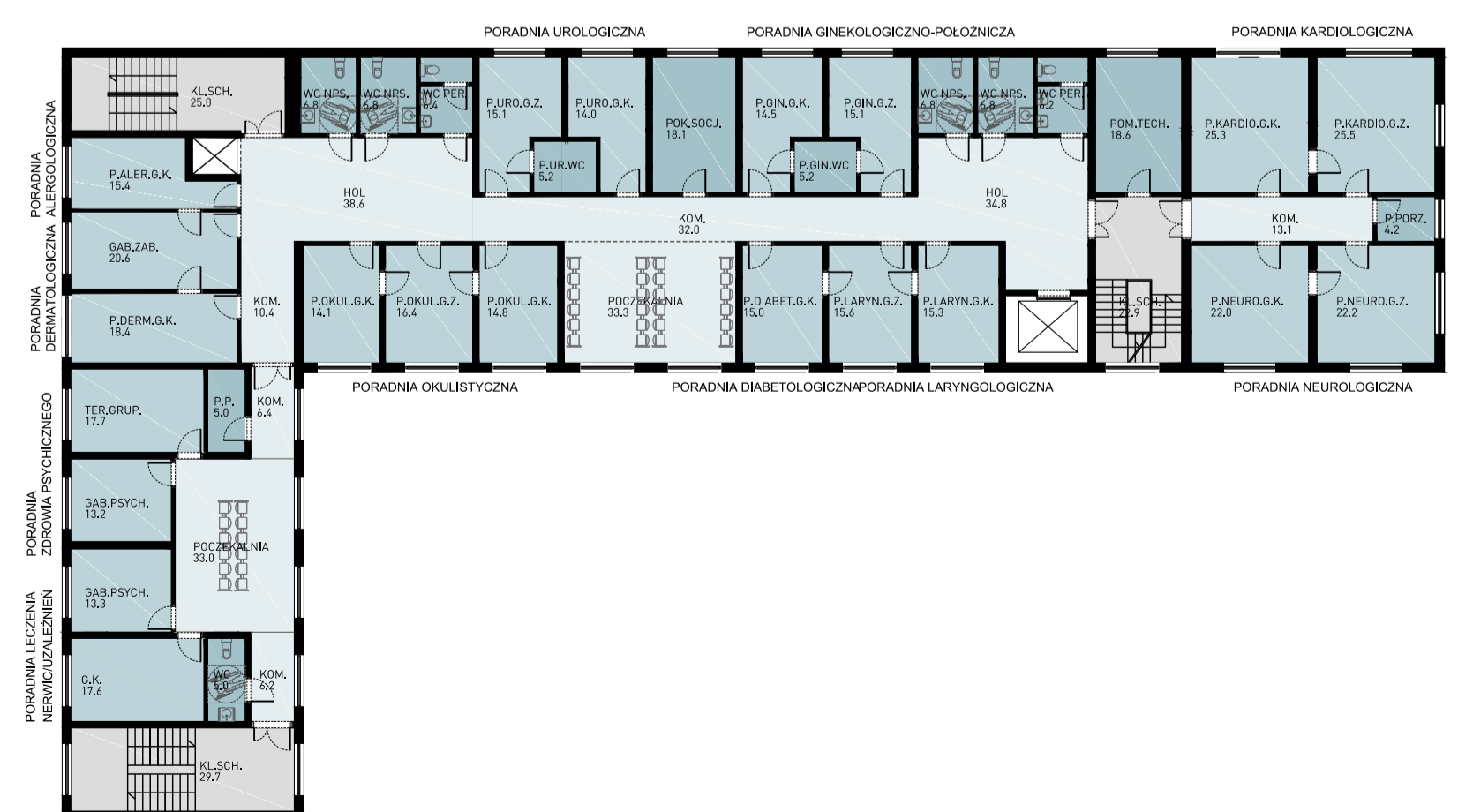
PROJEKTOWANA PRZEBUDOWA PORADNI SPECJALISTYCZNYCH W BUDYNKU B